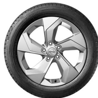
17" srebrna felga aluminiowa