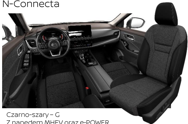
Czarno-szary - G Z napędem MHEV oraz e-POWER