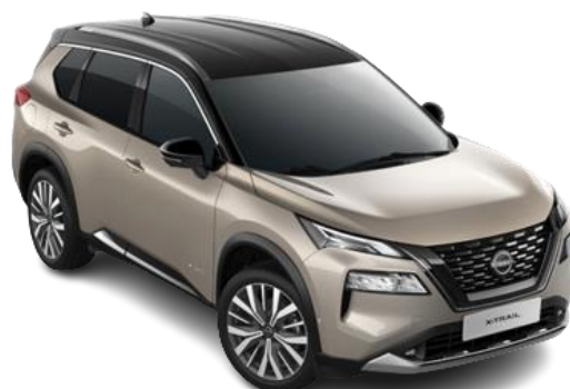
Szampański + Czarny dach - XEW