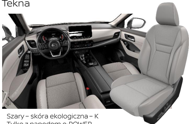
Szary - skóra ekologiczna - K Tylko z napędem e-POWER