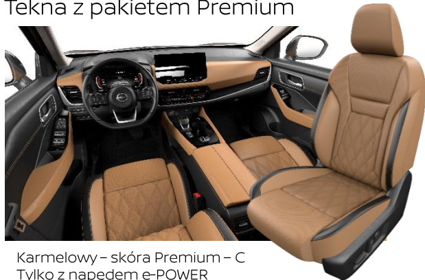
Karmelowy - skóra Premium - C Tylko z napędem e-POWER