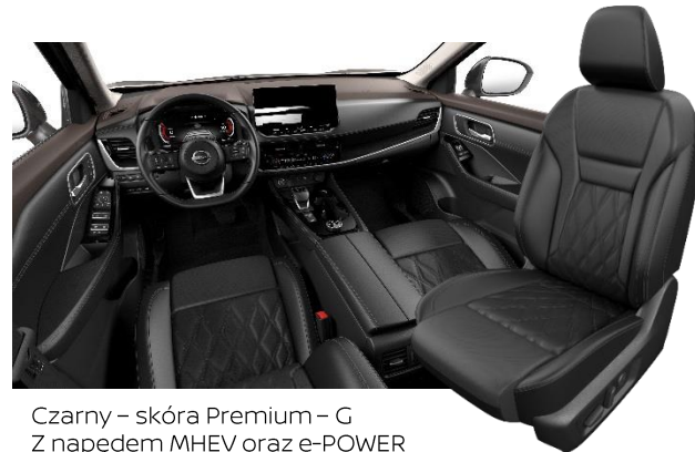
Czarny - skóra Premium - G Z napędem MHEV oraz e-POWER