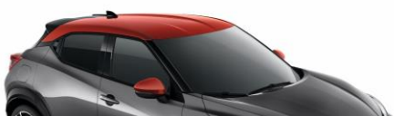
XFB SZARY + CZERWONY DACH „FUJI SUNSET”

*Wersja N-Sport dostępna w lakierach YAV, XKJ, XEX, GAQ, YAS