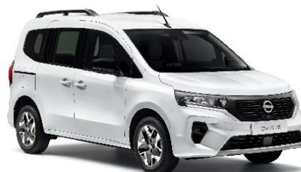
Biały – QNG