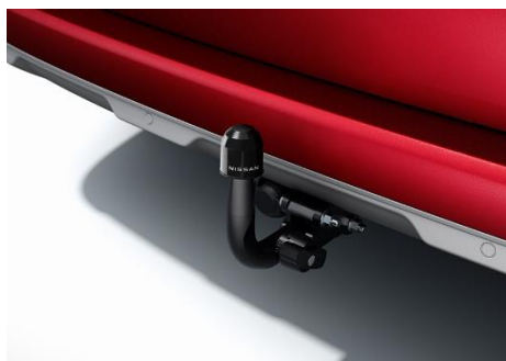
Hak holowniczy - zdejmowany