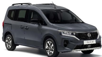
Ciemnoszary – KPW