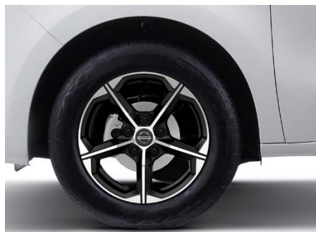
Felgi aluminiowe 16"