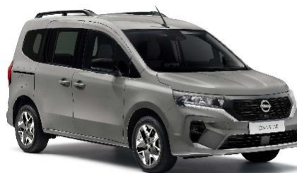
Szary Cassiopae – KNG