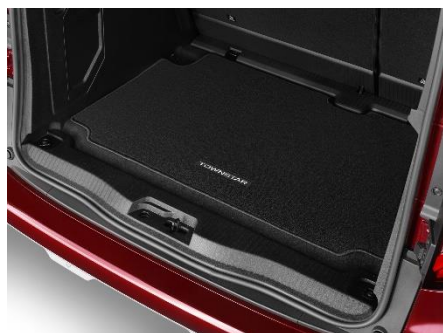
Mata bagażnika welurowa