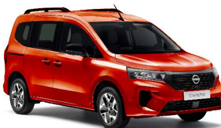
Pomarańczowy – CNZ