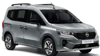
Szary Highland – KQA