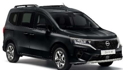
Czarny – GNE