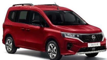
Czerwony Carmin – NPF