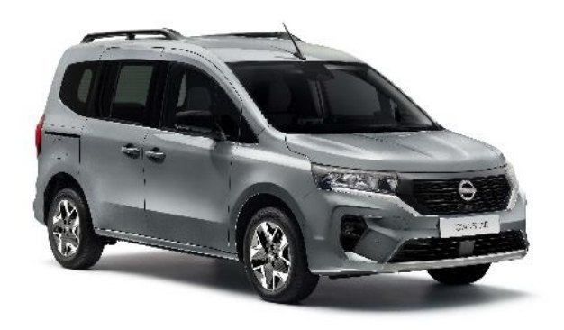
Szary Highland - KQA