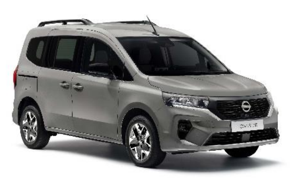
Szary Cassiopaee – KNG