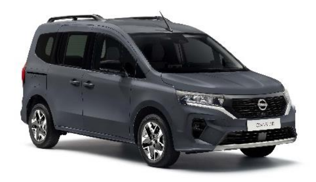
Ciemnoszary – KPW