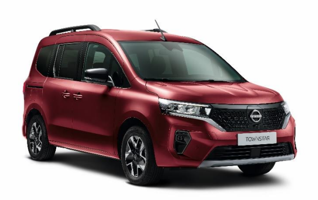
Czerwony Carmin- NPF