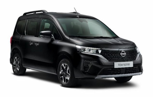
Czarny - GNE