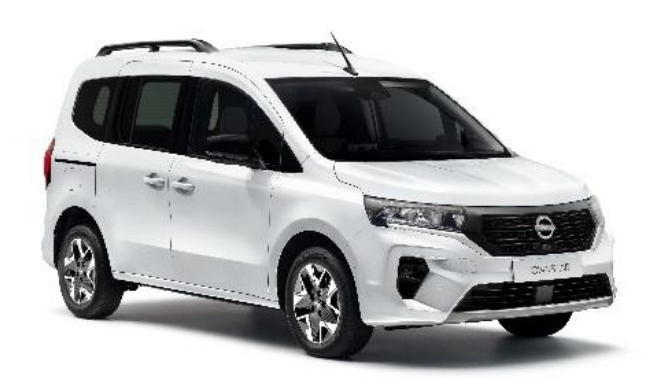
Biały - QNG