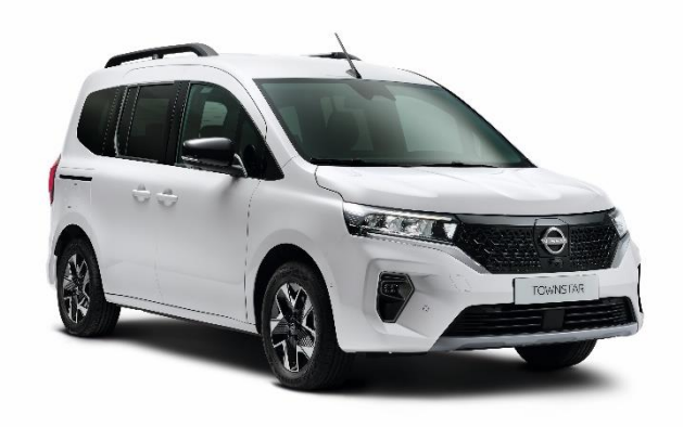
Biały - QNG