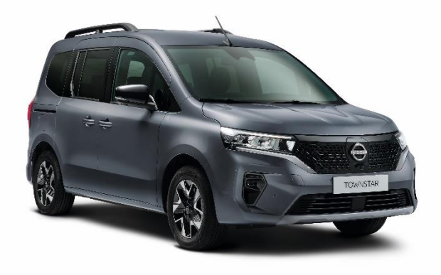
Ciemnoszary - KPW