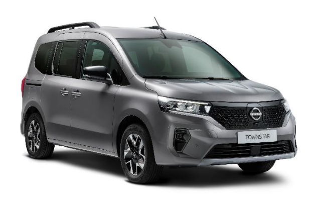
Szary Cassiopaee – KNG