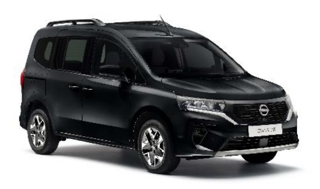
Czarny - GNE