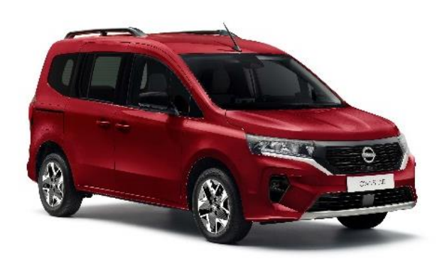
Czerwony Carmin- NPF