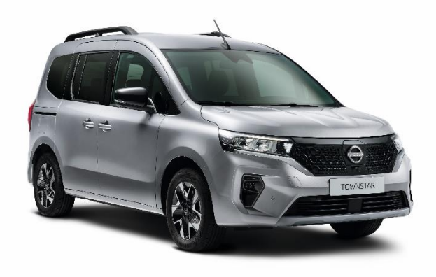
Szary Highland - KQA