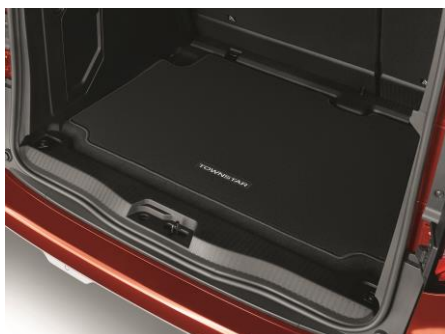
Mata bagażnika welurowa