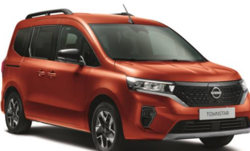
Pomarańczowy - CNZ