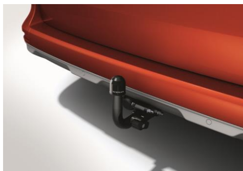
Hak holowniczy - zdejmowany