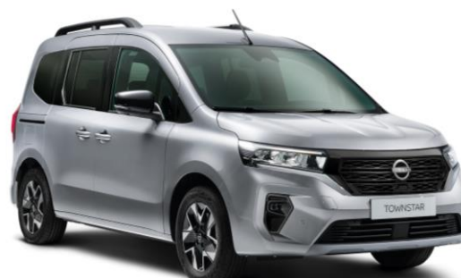
Szary Highland - KQA