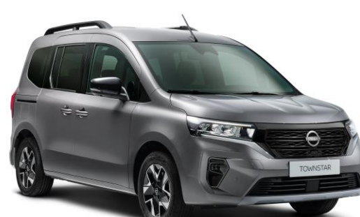
Szary Cassiopae - KNG