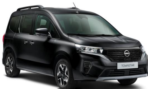
Czarny - GNE

Lakiery metalizowane / perłowe - 2 400 zł