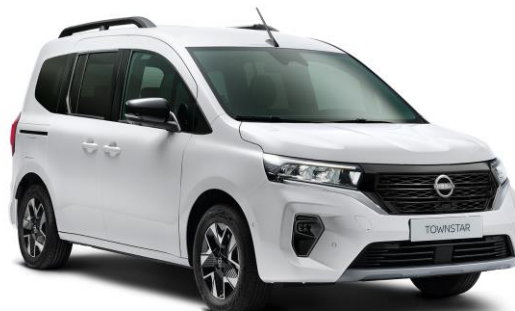
Biały - QNG

Lakiery metalizowane / perłowe - 2 400 zł