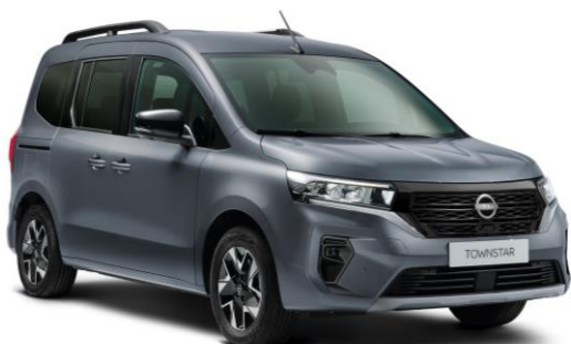
Ciemnoszary - KPW