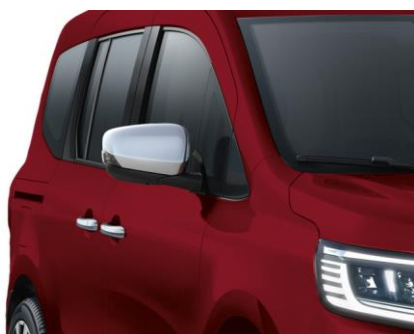
Nakładka na klamkę