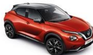
Czerwony Fuji Sunset + Srebrny dach - XEZ