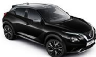
Czarny + Srebrny dach - XDZ