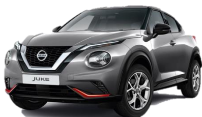
Miejski pakiet pomarańczowy