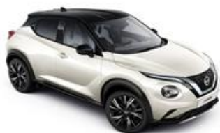
Biały perłowy + Czarny dach - XDF