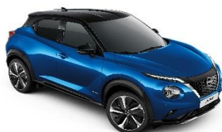
Niebieski + Czarny dach - XFV