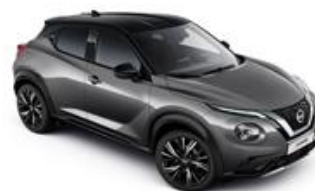
Szary + Czarny dach - XDJ