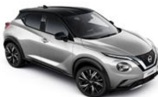
Srebrny + Czarny dach - XDR