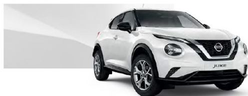
Biały - 326

Lakier metalizowany / premium – 2.400 zł