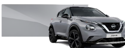
Szary ceramiczny - KBY