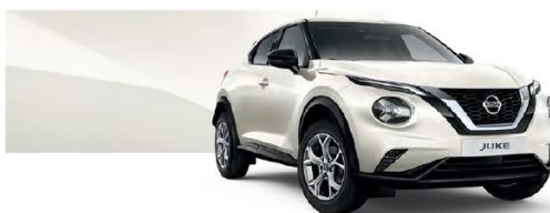
Biały perłowy - QAB