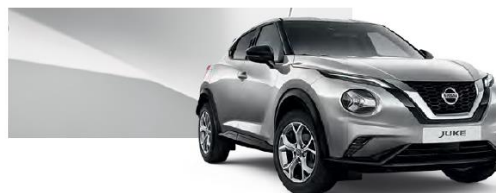
Srebrny - KYO