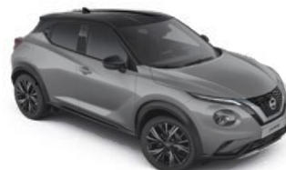
Szary ceramiczny + Czarny dach - XFU Personalizacja wnętrza N-Design: B

Dostępne 3 opcje personalizacji wnętrza dla wersji N-Design: