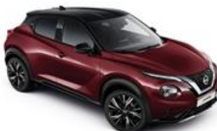
Burgundowy + Czarny dach - XDX Personalizacja wnętrza N-Design: B