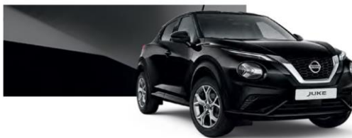
Czarny - Z11