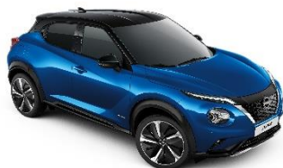
Niebieski + Czarny dach - XFV Personalizacja wnętrza N-Design: B