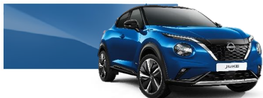
Niebieski - RCF